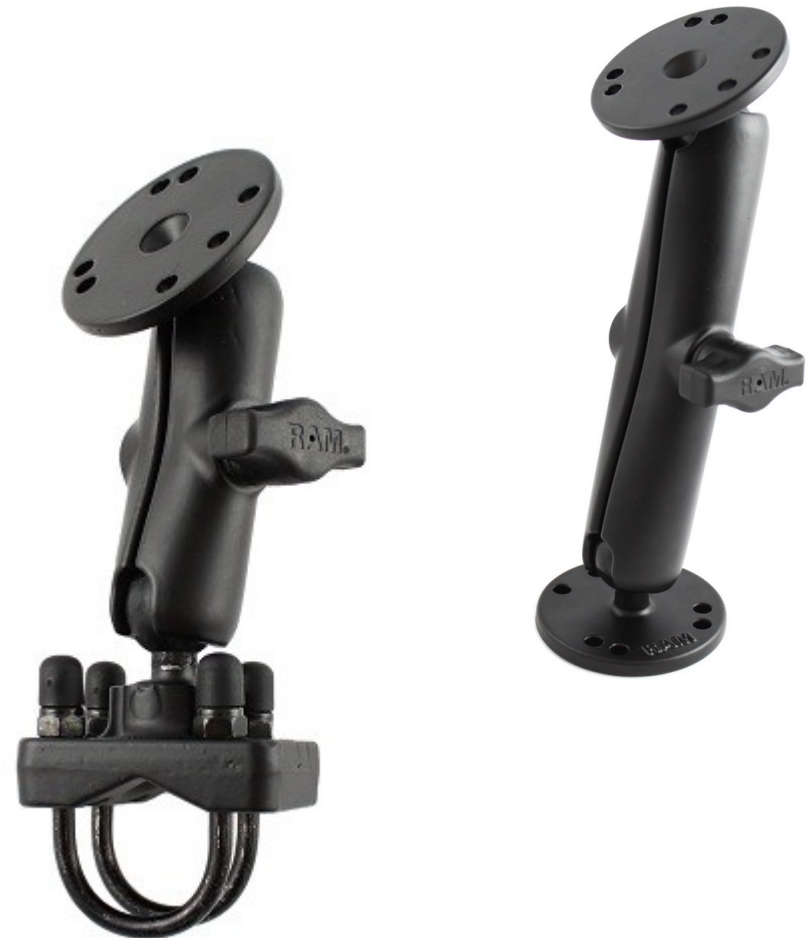
Befestigung bestehend aus RAM 202 (Kugel), RAM 201 (Mittelstück), RAM 235 (Rohrschelle mit Kugel).