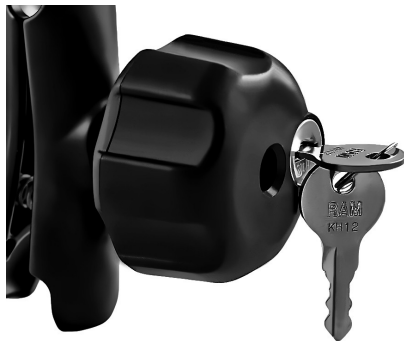
Zum Diebstahlschutz wird der Knebel am RAM 201 gegen den RAM KNOB ersetzt.