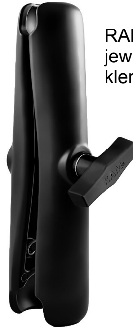
RAM 201 nimmt am Ende jeweils eine Kugel auf und klemmt diese fest.