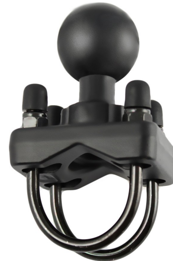
RAM 235 wird an einem Rohr befestigt und nimmt das Mittelstück (RAM 201) auf.