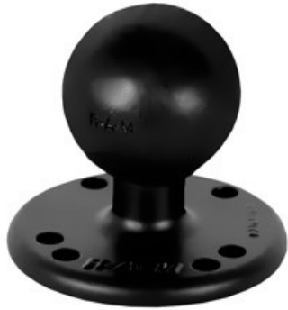
RAM 202 - Kugel wird am Case for iPad Air oder am Quick Snapper befestigt.